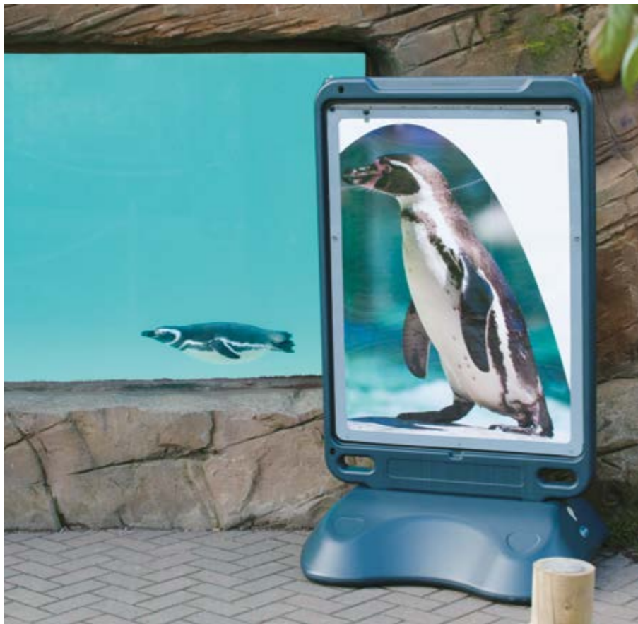
1. Panneau d'affichage autoportant Advocate