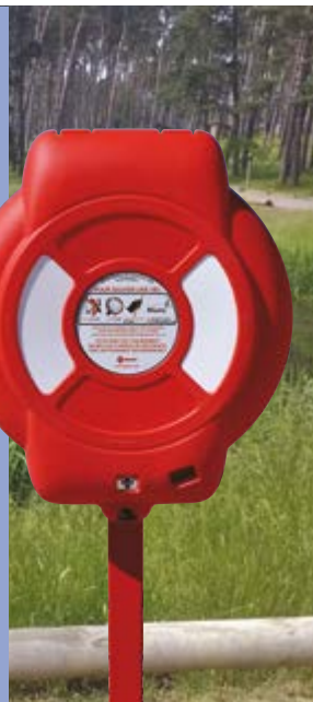
Coffre à bouée Guardian™

Notre gamme de matériel de sauvetage inclut, une bouée de sauvetage de type couronne de 600 ou 750 mm de diamètre accompagnée d'une ligne de vie de 30 à 50 mètres de long, d'un coffret à bouée, d'une bouée B-Line™ composée d'une de corde de 31 mètres de long et tout l'équipement de sauvetage nécessaire. Cette gamme de produit a été conçue de sorte que tout l'équipement proposé peut être stocké dans des coffrets spécialement conçus (650 ou 700 mm), testés et approuvés pour une utilisation sécurisée.