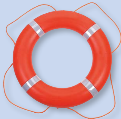
Bouée 750 mm