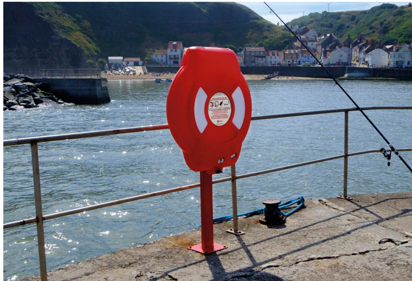
1. Coffre à bouée Guardian 750 sur poteau

Les coffres à bouée Glasdon ont été conçus pour protéger votre matériel de sauvetage tout en étant à la fois très visibles et très résistants. Nos coffres à bouée conviennent parfaitement pour les sites où la présence d'eau représente un danger, comme les ports, les plages, les piscines ou les stations d'épuration.